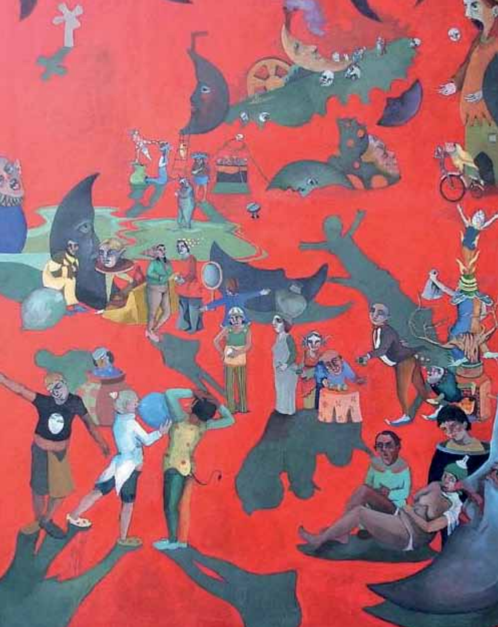
Schattenwelt Öl auf Leinwand 162 x 130cm