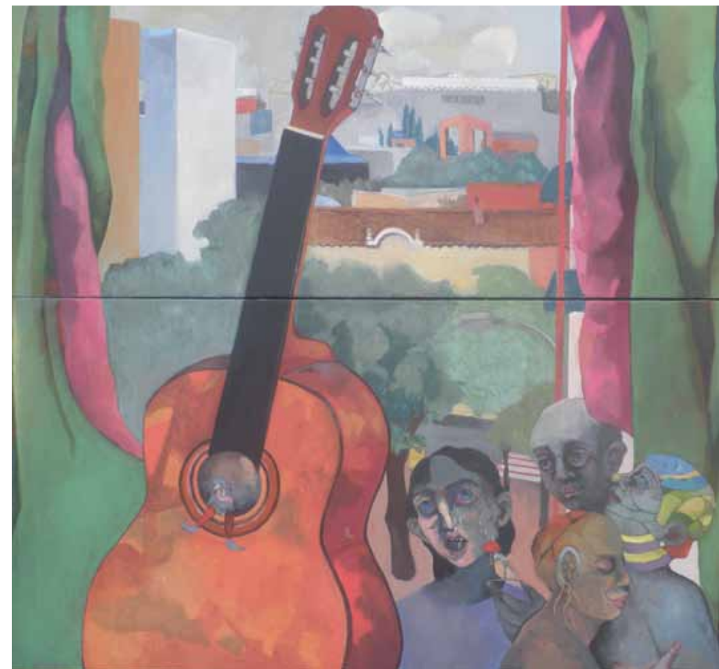
Ins Nichts Erscheine Öl auf Leinwand 90 x 100cm