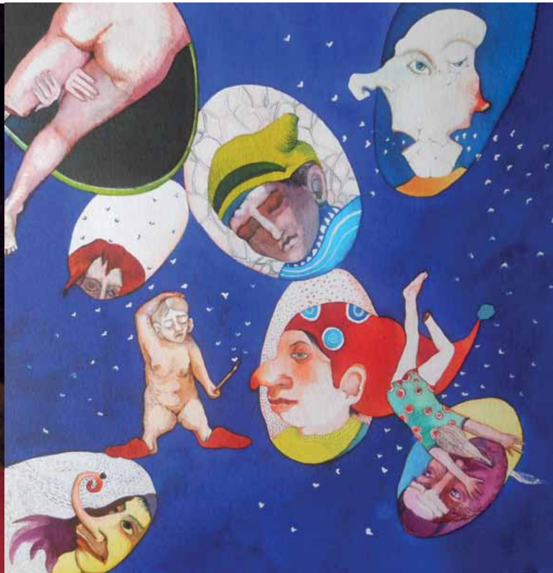
Spiegel Und Fliegen