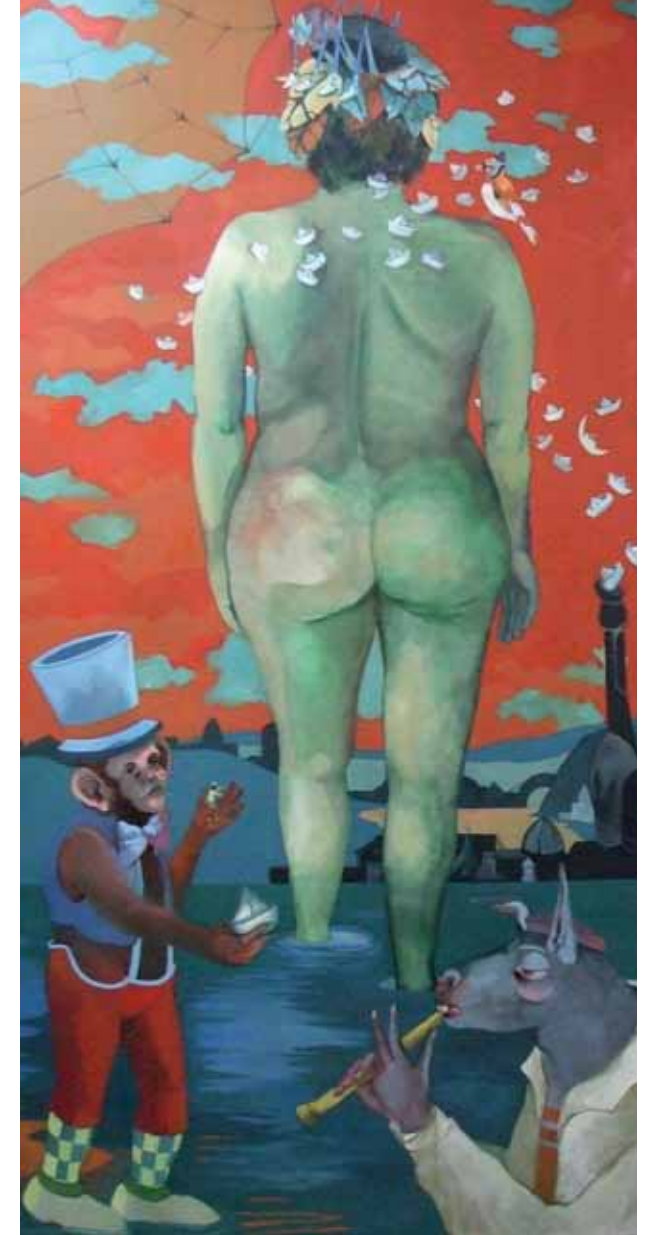
Papierschiffe Öl auf Leinwand 195 x 97cm