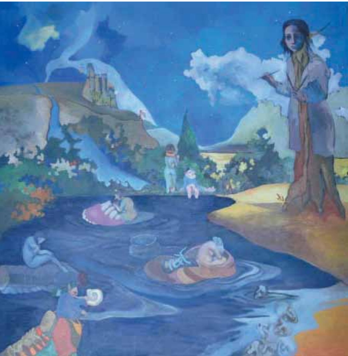
Vertikale Flüsse Öl auf Leinwand 100 x 100cm