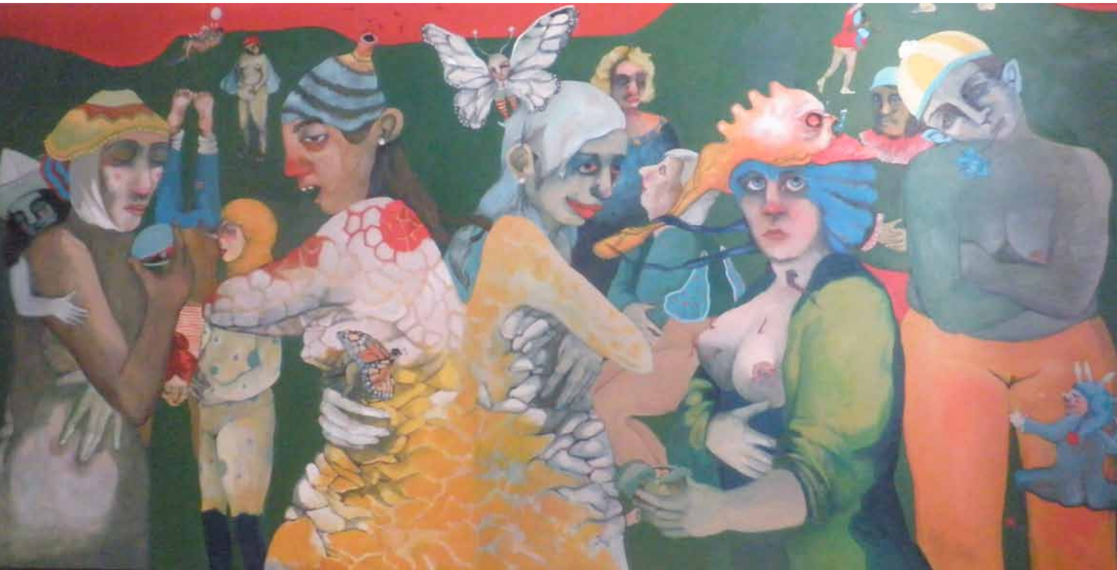
Schmetterlinge Umarmung Öl auf Leinwand 100 x 200cm