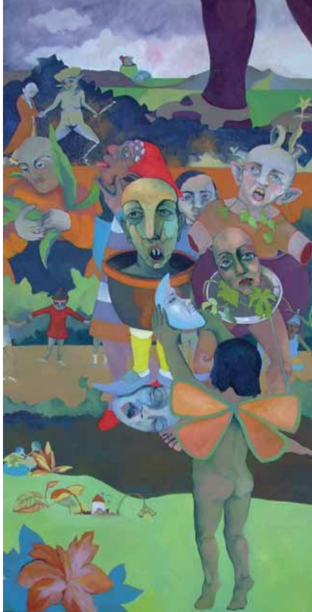
Aus Meinem Garten Öl auf Leinwand 195 x 95cm