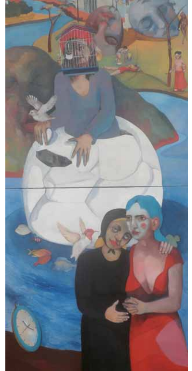
Die Schweigen Des Ei Öl auf Leinwand 200 x 100cm