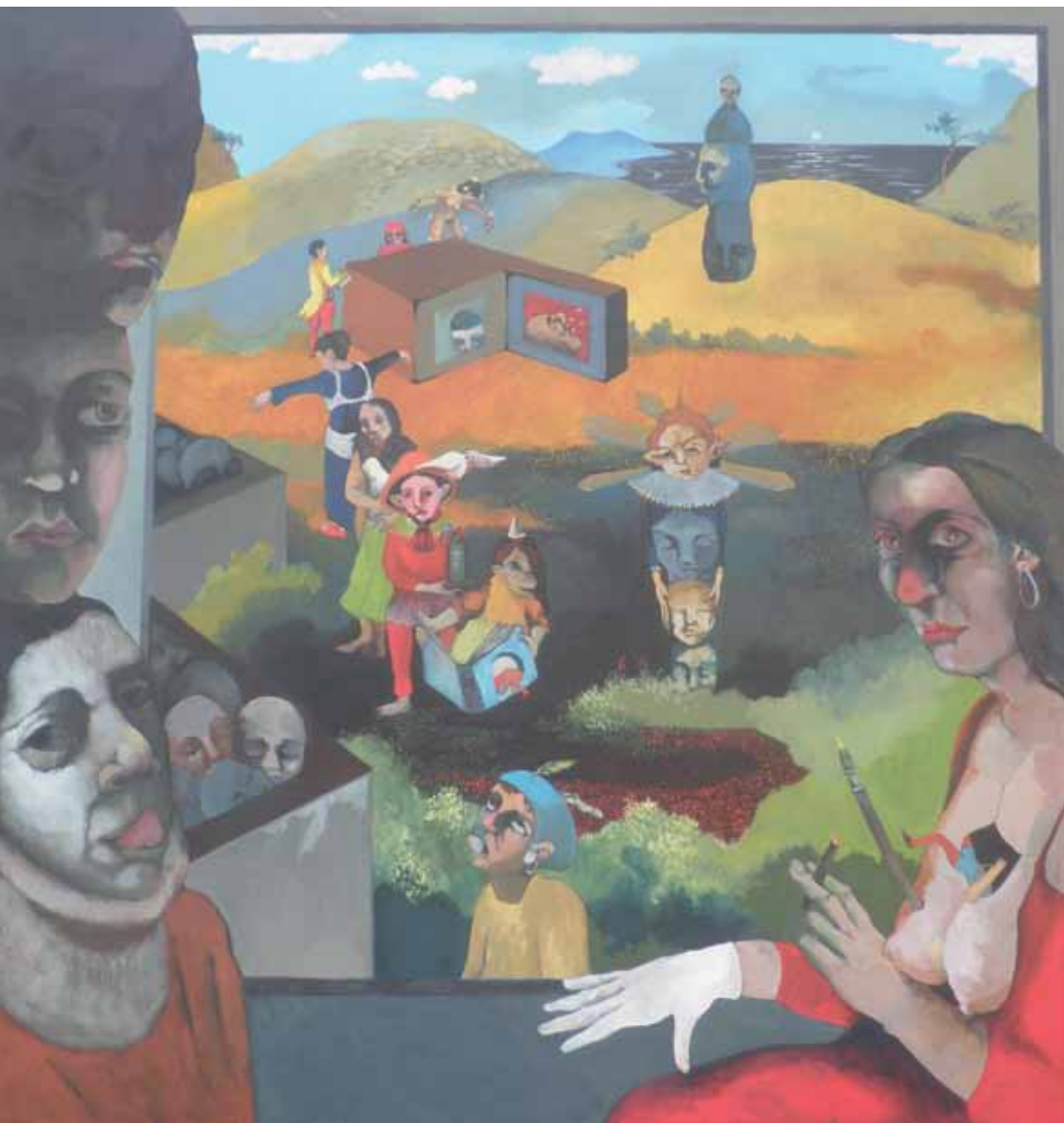
Das Totem Öl auf Leinwand 100 x 100cm