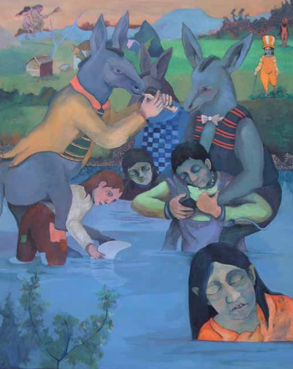
Wie Die Esel Hinauf Laufen. Ehrung Für Goya Öl auf Leinwand 100 x 81cm