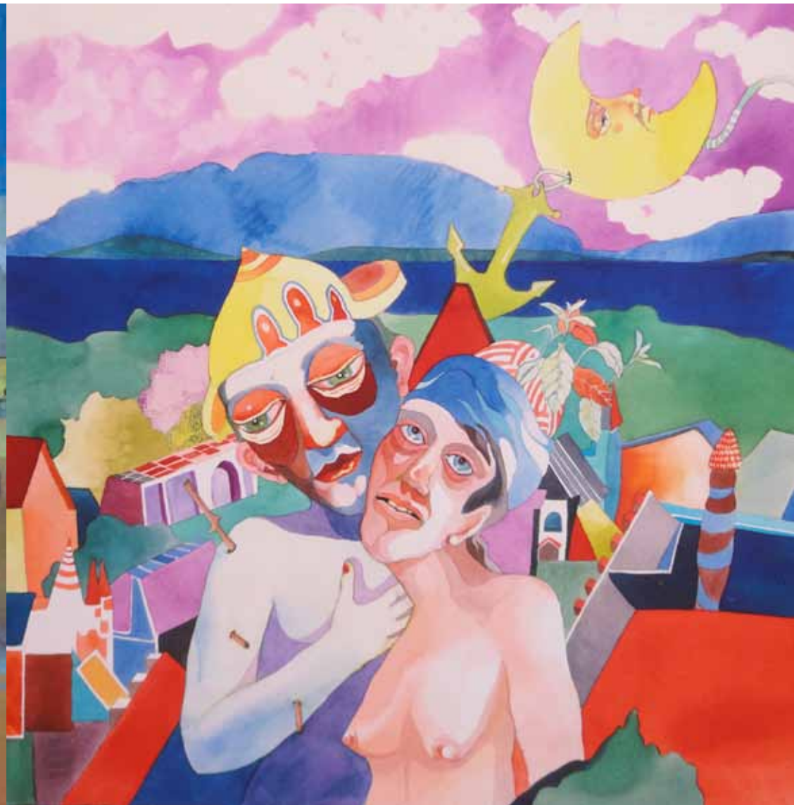
Träumenverankerung Aquarell auf Papier 50 x 50cm