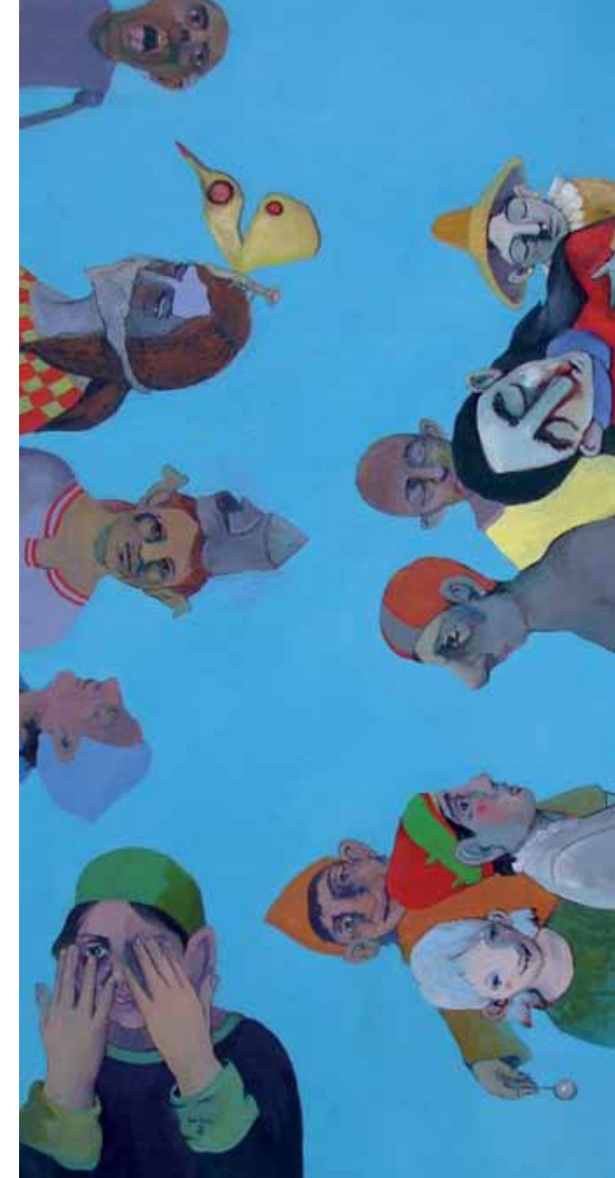
Standpunkte Öl auf Leinwand 100 x 150cm